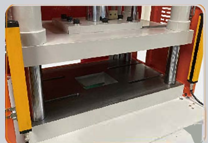
安全光電柵開關 Safety Light Grid