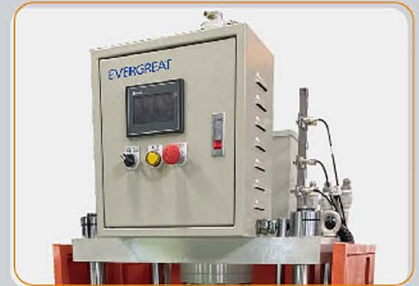
觸控螢幕 Touchscreen Panel